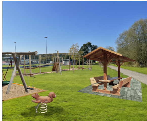
KI generierte Animation